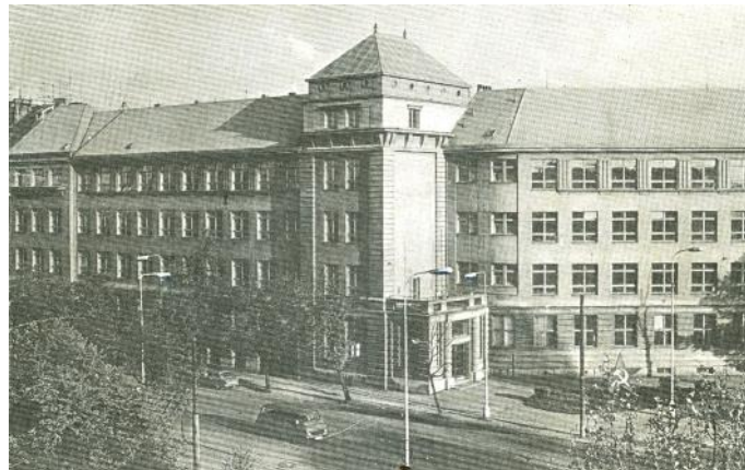
Snímek školy z 80 let. Popisovaná „zeměkoule“ stála přes ulici přímo proti své družce, rudé hvězdě

Po několika letech prodělal tento neřestný prostor proměnu. Prvotní příčinou (tady se