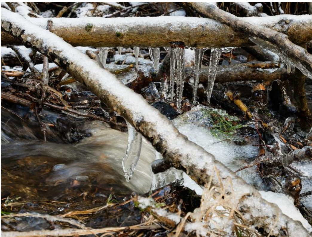
Potok v polesí Vysoká kousek od Plzně

Je tam hezky a když Plzeň sužuje inverze, tam svítí sluníčko. Přímo na kótě Vysoká nad Čizicemi jsou nádherné kamenné útvary. A v současnosti tam není živá duše.