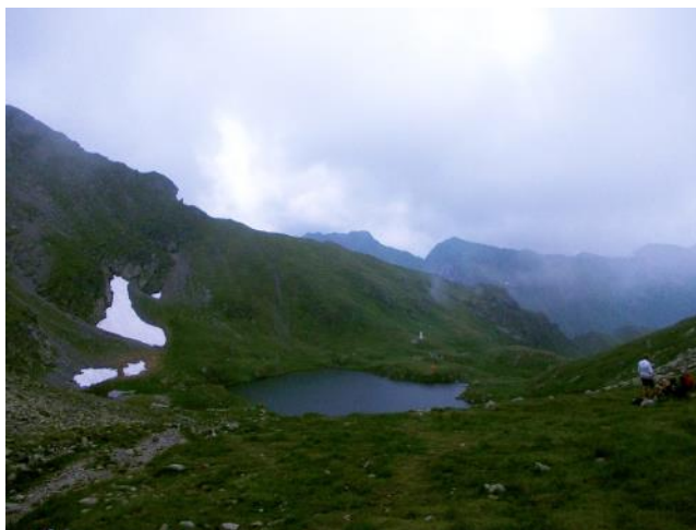
Capra, Vistea Mare, Moldovianu

ný moderní kostel naproti hradu a pak už vyrážíme do hor. Trochu se vracíme, kudy jsme přijeli a pak dolinou Avrig stoupáme k dolní stanici lanovky, která