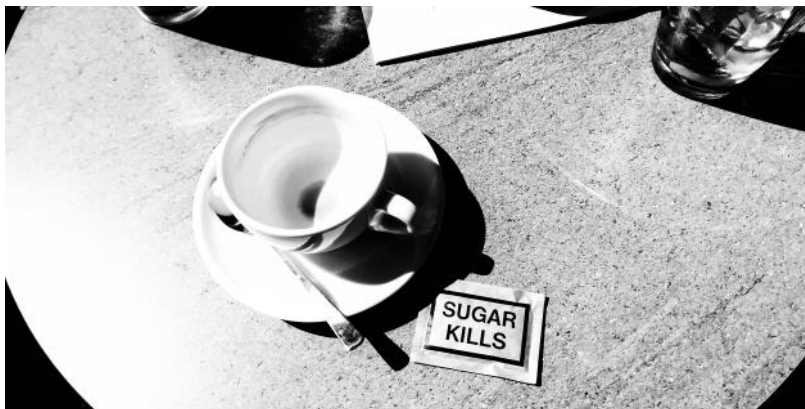
Nebezpečí dnes číhá všude.

© 2021 pro školní zpravodaj (pokračování příště)