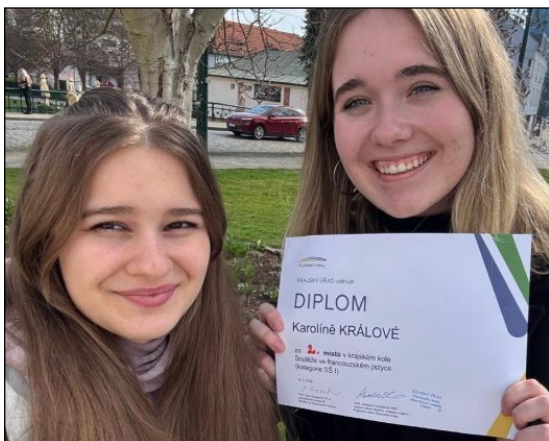
Na snímku vpravo jsou účastnice školního kola.