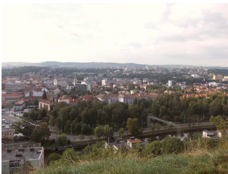
Cluj — Napoca

sejít po schodech dolů do obrovské vytěžené solné komory. Má rozměry asi dvou fotbalových stadiónů a hluboká je okolo 100 metrů. Na dně je „pastička“ na peníze turistů. Lze tu hrát tenis, minigolf, je tu ruské kolo, malé odchody se suvenýry a občerstvením. Dá sjet ještě asi o 50 metrů níže, kde je solné jezero a lze tu půjčit loďky. Voda je nasycená solí, takže