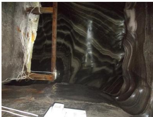
Solné doly Turda

rozzrústat; od roku 1272 sem přicházeli němečtí kolonizátoři a řemeslníci, ti původní latinský název přeložili na Klausenburg. Roku 1443 se zde narodil Matyáš Korvín. Historické centrum města s chrámem sv. Mikuláše a radnicí bylo opevněno hradbami. Roku 1550 ve městě zvítězila náboženská reformace, v čele stáli luteráni vedení Gá-