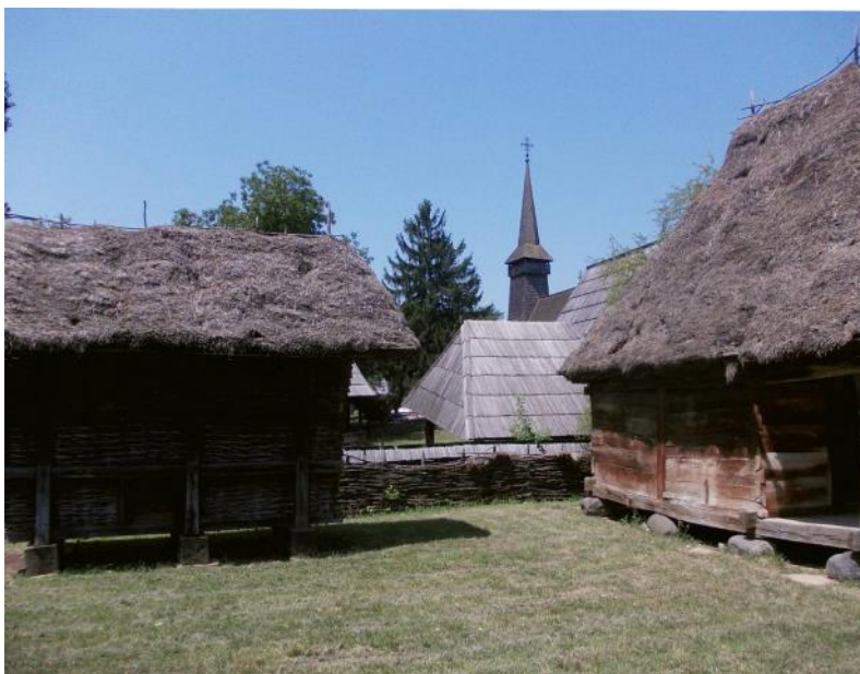
Bukurešť - skanzen

pastevec Bucur, podle něhož je i pojmenováno. Bucur údajně postavil i kostel, který se dochoval dodnes. Písemně je