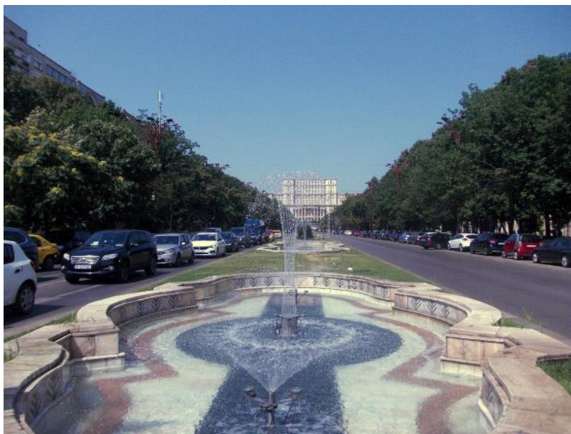
Bukurešť - parlament

prohlíží místní do- vě závody jsou asi sem meziměstská předmětem jeho me centrum. Je to „rumunských tram-