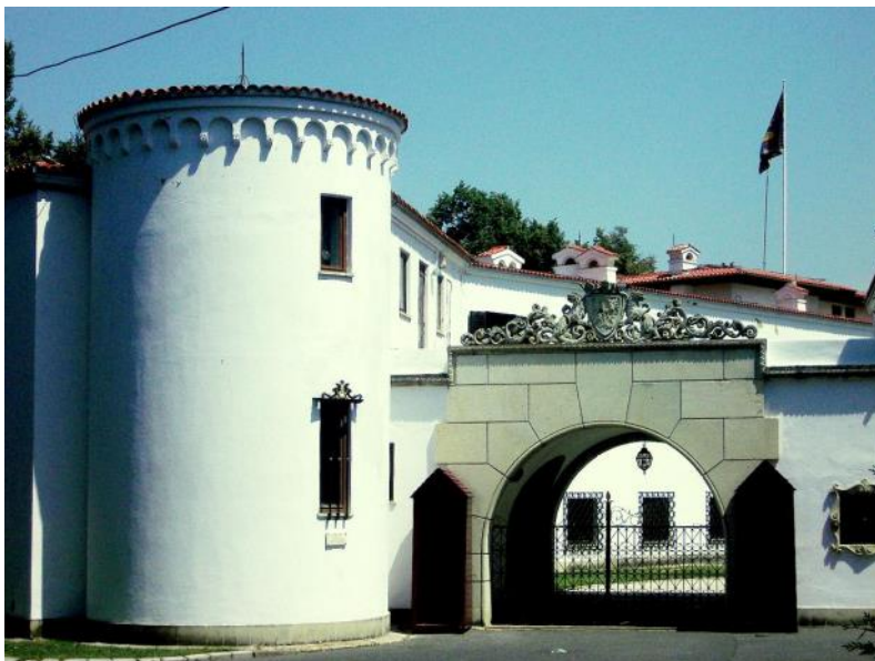
Bukurešť - prezidentský palác

pastevec Bucur, podle něhož je i pojmenováno. Bucur údajně postavil i kostel, který se dochoval dodnes. Písemně je