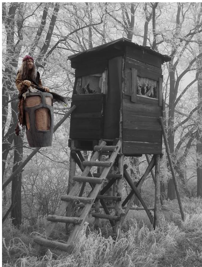
K lesu zády, ke mně vchodem!

© 2021 pro školní Zpravodaj (pokračování příště)